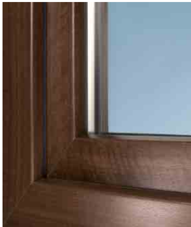
Dekorfolie Siena Noce*