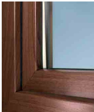
Dekorfolie Siena Rosso*

*drucktechnisch bedingte Abweichungen zum Original sind möglich